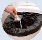
使用イメージです。