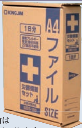
開ける前は A4ファイルサイズ