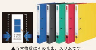
▲収容枚数はそのまま、スリムです！

術 人が増えたり、新プロジェクトが始まったりすると収納スペースが足りなくなることもあるだろう。そんな時はこういった【枝ありファイル】を活用することで収納スペースをアップさせよう！