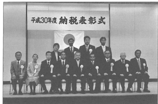
↑ 納税表彰 受彰者