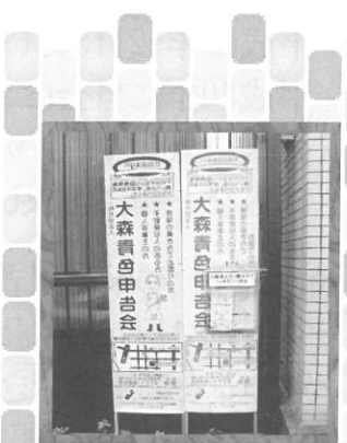
一街中の物言わぬ申告会の立て看板広告

期限は平成30年11月30日までにご入会の手続きを完了された方です。是非、お近くのお知り合いをご紹介ください。