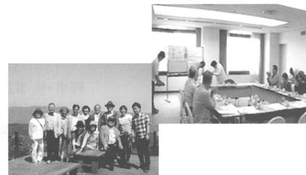
平成29年度「確定申告期報告」

役員・会員の皆様には、確定申告期のお忙しい中、青色コーナーへの従事や税理士会の無料相談受付など、多大なるご協力をいただきましたこと感謝申し上げます。大変にありがとうございました。