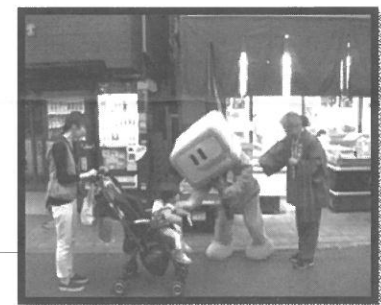
梅屋敷商店街にてイータ君と親子連れ