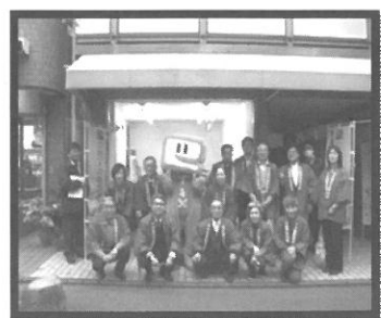
美原通り役員宅前での記念撮影