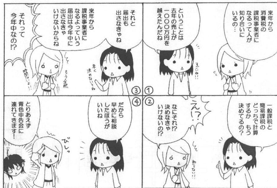
「消費税の届出」の巻

消費税の届出は課税期間が開始となる前日までの提出が必要になるものがほとんどです。確定申告の際に手遅れになることが予想されますので、早めのご相談を心掛けてください。