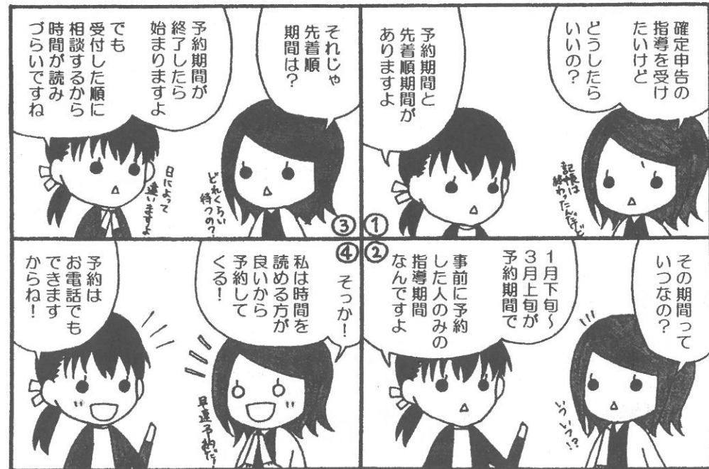
確定申告のご予約

詳細は、「本誌の4面」及び12月上旬にお送りしました「おおもり青色便りの号外」をご確認ください。お早目のご予約をお願いいたします。 大森青色申告会 (TEL)03-3771-8859