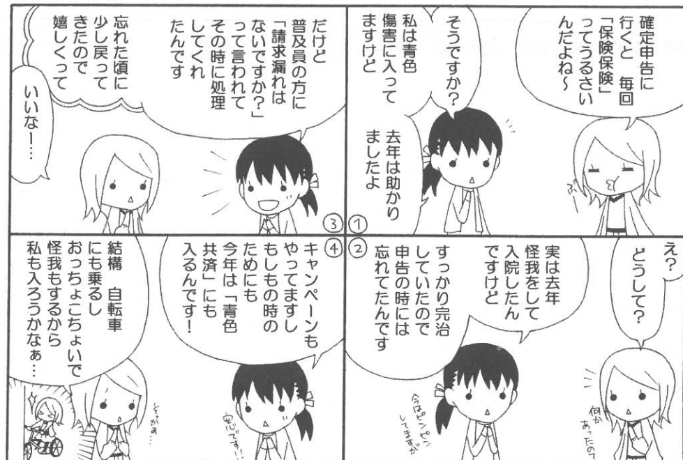
東京青色傷害保険 〜キャンペーン編〜

東京青色傷害保険はけがが原因の通院や入院等を補償する保険です。月額1000円の掛金で国内・海外でも、工作中や日常生活中でも、地震・天災・火事によるけがでも、交通事故によるけがでも、通院も入院も1日目から補償します。確定申告期間中には青色共済と青色傷害保険のキャンペーンを行っていますので是非ご加入ください。