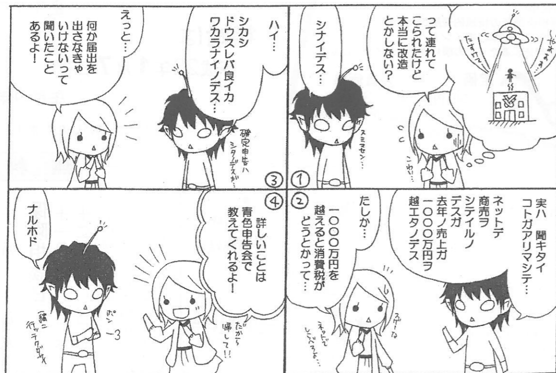
「消費税届出」の巻 パート2

上記の場合、「消費税課税事業者届出書」の提出が必要です。また、一般課税か簡易課税の選択も必要となりますので、平成27年12月25日までに申告会へお越しください。