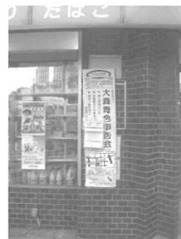
← 役員さんの店舗でのPR例