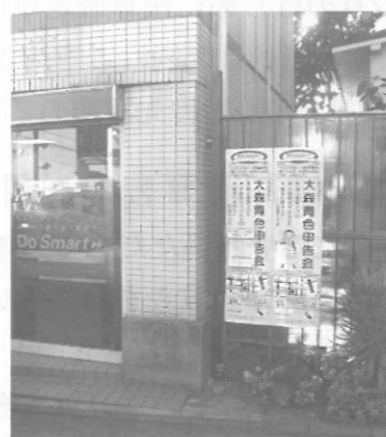
→ 役員さんの敷地でのPR例

皆様のお知り合い、ご近所、同業者等の方で 『新たに事業を始められた方』 『不動産経営をされている方』 『業務請負契約等で確定申告が必要な方』 『その他確定申告が必要な方』 等いらっしゃいましたら ご紹介下さい。 ご紹介者の方にも、お知り合いの方にも 嬉しい特典をご用意して お待ちしております！