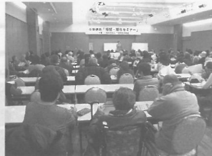
公開講座「相続・贈与セミナー」開催

11月11日~13日の3日間青色推進委員会の委員が中心となって、梅屋敷東通商店街、ショッピングモールMILPA、池上仲通商店街をe-Taxの普及や青色申告会のPRパンフレットを配り広報活動を行いました。