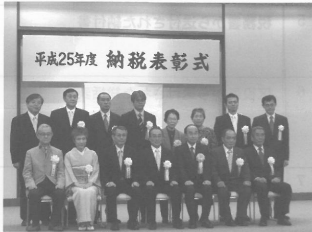
平成25年度 納税表彰式

平成二十五年十一月十九日(火)午後三時四十五分より朗峰会館にて、大森税務署・大森税務六団体の共催による平成二十五年度納税表彰式が執り行われた。当会からは永年にわたり青色申告の普及育成と納税道義の高揚に貢献され、かつ当会の発展に寄与された次の方々が表彰された。