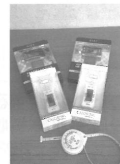
ダイエット用カロリズム

只今3月15日までに、青色共済・青色傷害にご加入いただくと、先着50名にダイエットに役立つ「カロリズム」などがあたるキャンペーンを実施しています。詳しくは事務局まで。