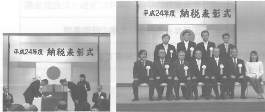
↑ 会長表彰 受彰者

平成二十四年十一月十五日(木)午後三時三十分より池上会館に於いて、大森税務署・大森税務六団体の共催による平成二十四年度納税表彰式が執り行われた。当会からは永年にわたり青色申告の普及育成と納税道義の高揚に貢献され、かつ当会の発展に寄与された次の方々が表彰された。(敬称略・順不同)