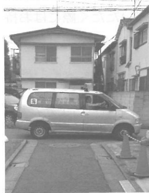
役員さんによる 広報車活動

また、青色申告連絡所として立て看板の設置が出来る方を募集しております。会勢拡大期間中または常設が可能な方は申告会事務局(3771-8859)までご連絡下さい。