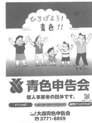
区の掲示板、役員さんのお店でPR