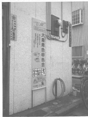
会勢拡大運動期間の看板 (期間が終わったら燃えるゴミで)