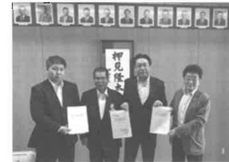
大田3会の代表と大田区議会議員