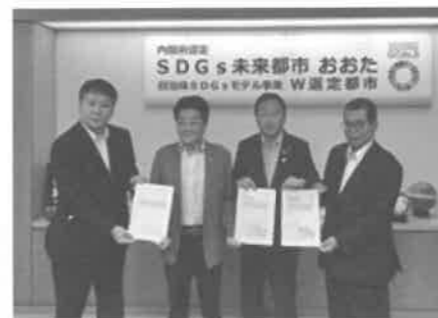
大田3会の代表と大田区長

当会報10月号に「陳情はがき」を同封しております。皆様の1通のはがきが、大きな声、大きな力となりますので是非ご協力をお願いいたします。