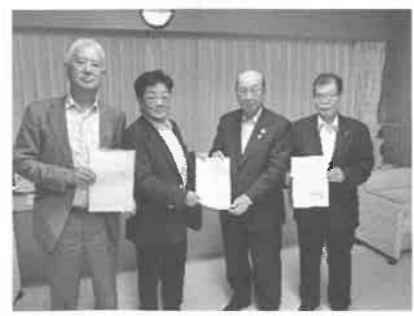
大田3会の会長と大田区長

青色申告会では、毎年、固定資産税と都市計画税の軽減措置を継続することの要望運動を行っています(令和4年度は621億円もの税負担が軽減されました)。この度、令和4年9月2日(金)に、大田区役所へ赴き「固定資産税・都市計画税の軽減措置」に対する継続要望を、大田区長並びに大田区議会議員へ陳情して参りました。また、都議会議員にも陳情書を提出いたしました。皆様へ先月配布しました当会会報9月号に『陳情はがき』を同封しております。皆様の1通のはがきが、大きな声、大きな力となりますので是非ご協力をお願いいたします。