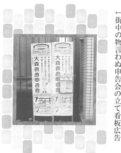
一街中の物言わぬ申告会の立て看板広告

勧奨運動期間は会員募集キャンペーンを実施しております。ご入会手続き時に「大森青色申告会の立て看板を見た」とお伝えいただきご入会いただくと、ナント！当会の入会金6,000円とご入会日から令和元年12月分までの会費が無料になるお得なキャンペーンです。期限は令和元年11月29日までにご入会の手続きを完了された方です。是非、お近くのお知り合いをご紹介ください。