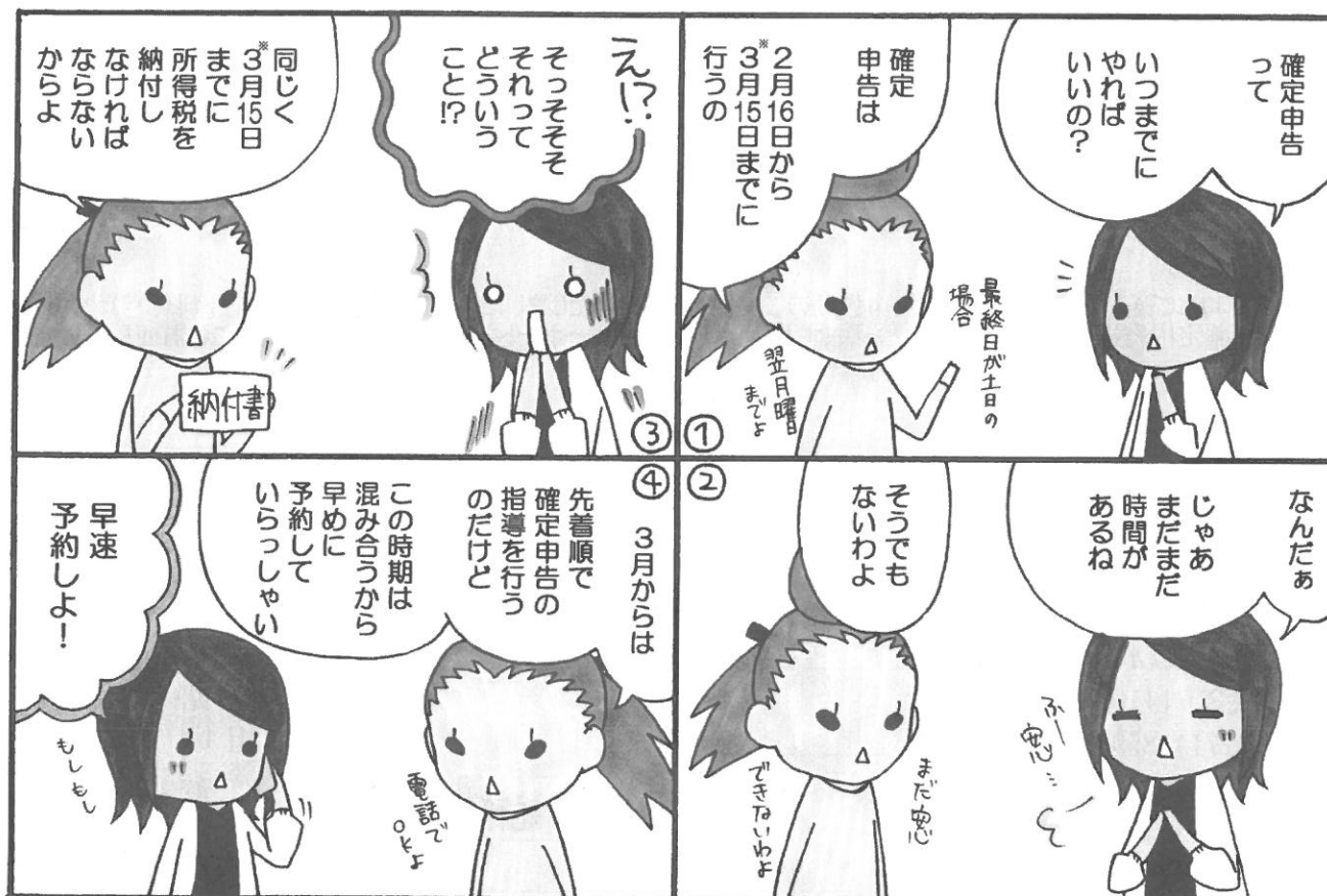
「所得税確定申告の期間って〜の巻」

※ 予約制の個別相談は、お電話にてご予約をお受けいたします。TEL: 03-3771-8859 本「おのり便り」4ページにもその他相談会の日程が掲載されています、併せご覧ください。