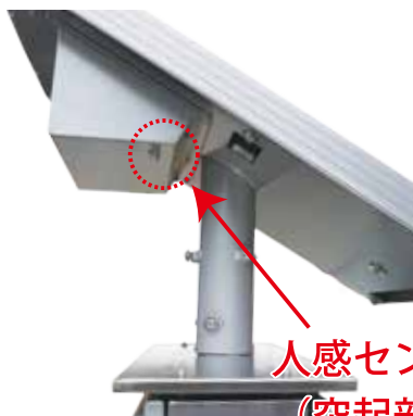
人感センサー (突起部分)