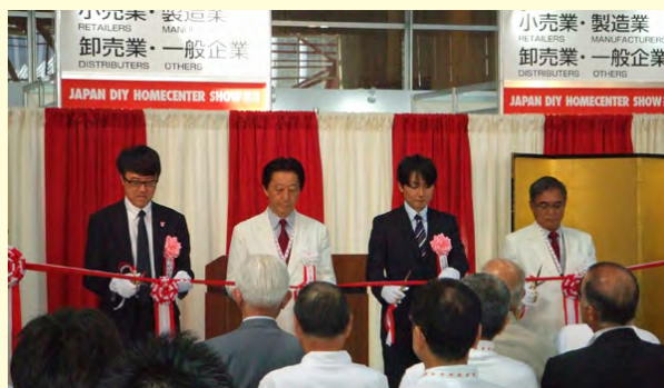
* 開会式・テープカット

JAPAN DIY HOMECENTER SHOW 2013 が、高円宮妃久子殿下を名誉総裁にお迎えし、8 月 29 日（木）－8 月 31 日（土）の 3 日間、千葉県幕張メッセで開催されました。