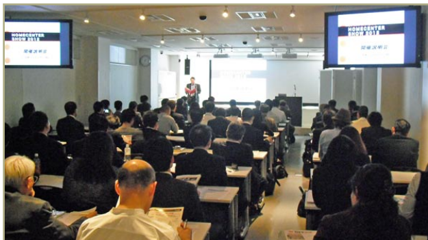
展览会 2012 召开说明会的情景

2012 年日本 DIY 家庭用品购物中心展览会实行委员会（稻叶敏幸实行委员长），于 11 月 17 日（星期四）在家萨姆神田厅（东京都千代田区神田锻冶町），举办了 2012 年展览会的召开说明会。