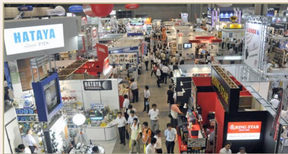
* 照片是上次展会的场景

国内外 DIY 相关企业聚首一堂的国内最大级与居住生活有关的综合展示会 2012 年日本 DIY 家庭用品购物中心展览会，将于 2012 年 8 月 23 日（星期四）至 25 日（星期六）三天，在千叶县的幕张万国物产国际展示场举行。