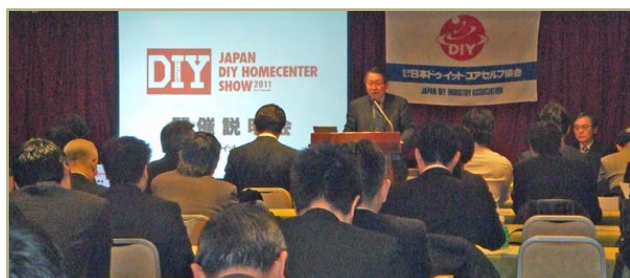
上次举办说明会的情景