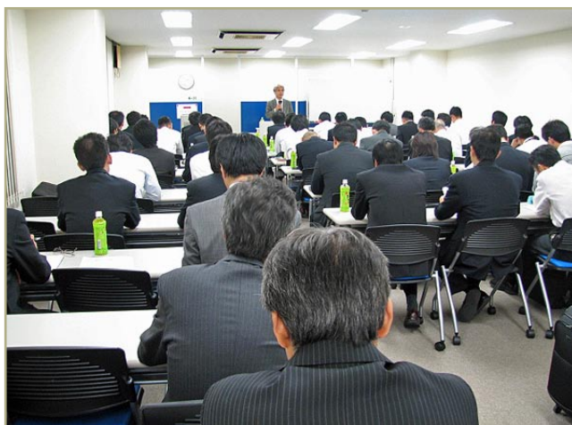
第66回マーケティング講座受講風景