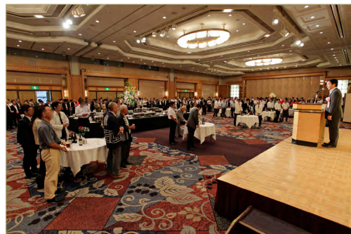
上次（2015年）联谊会的情景